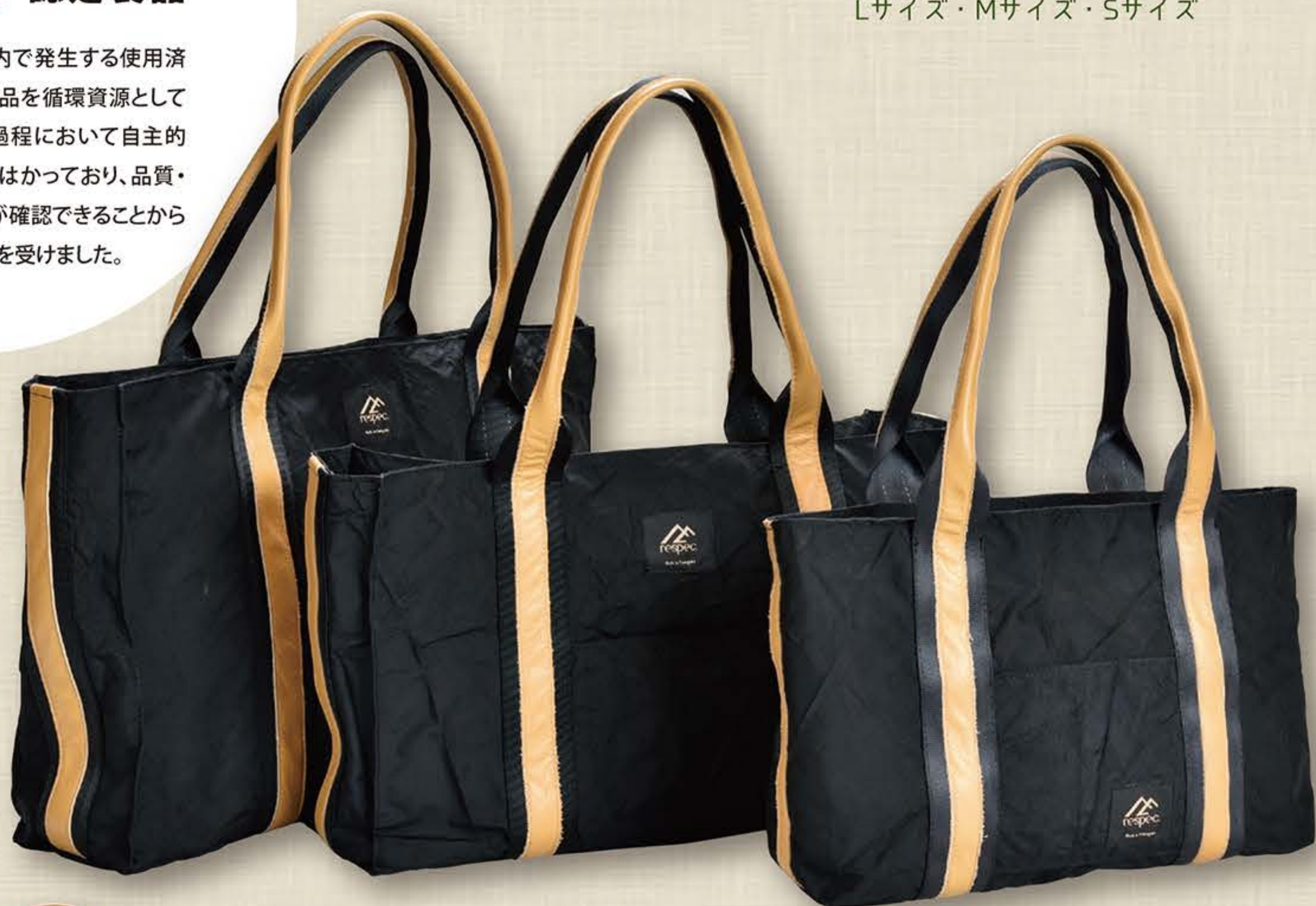
R Tote Bag L/M/S 主にエアバッグが素材のトートバッグ Lサイズ・Mサイズ・Sサイズ

本製品は、県内で発生する使用済み自動車の部品を循環資源として使用し、製造過程において自主的な環境管理をはかっており、品質・性能・安全性が確認できることから山形県の認定を受けました。