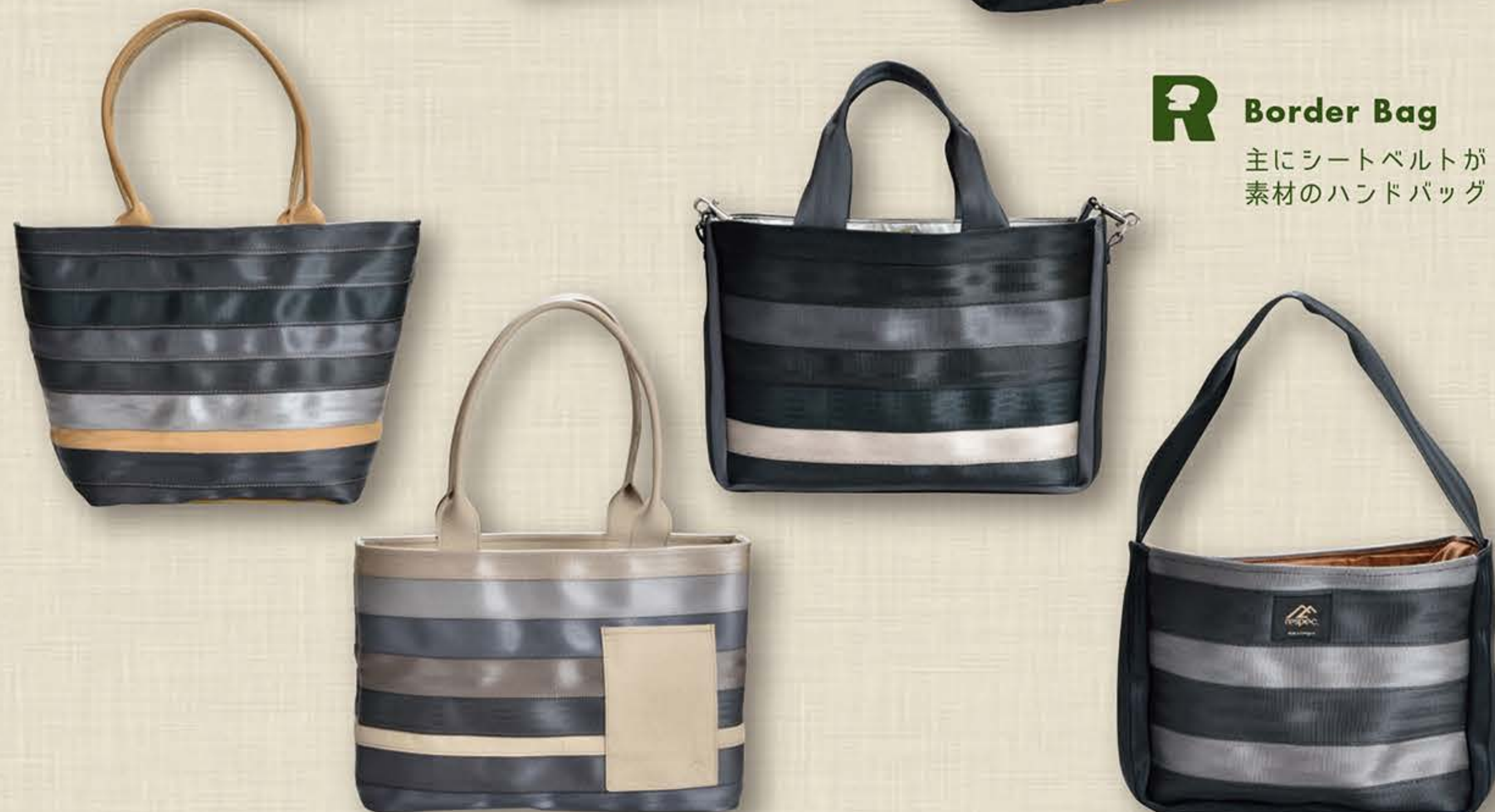
R Border Bag 主にシートベルトが素材のハンドバッグ